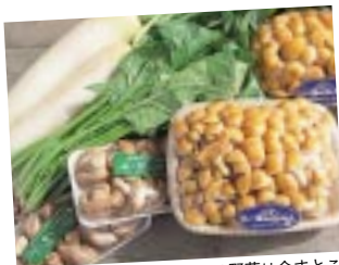
大自然が育んだ地場で採れる野菜は余すところなく食べられます

富士山の麓、朝霧高原にやってきました。豊かな自然と澄んだ空気の中、放牧されている牛を間近で見た息子は初めて見る大きな牛に大興奮。少し進み、道の駅朝霧高原に着きました。ここでは今話題のバナジウム水が無料とあって、早速汲みたてをゴクリ。やわらかな口あたりで、こんな暑い夏の日には何よりのごちそうです。脂肪燃焼効果があるらしく、飲み続けると痩身も期待できるそう。ペットボトルに水を汲んだ後は、甘いもの好きにはたまらない朝霧のソフトクリームを買い、まかいの牧場へと向かいました。気象条件がよかったので熱気球に乗ることに。息子はもちろん、私も初めての体験。すがすがしい風の中、ゆったりと空中散歩を楽しみました。地上とはまた違った富士山の姿や高原の緑は例えようのない美しさでした。あ、ちなみに主人はこわいと言って、下でお留守番でした。