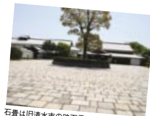
石畳は旧清水市の路面電車のものを利用しているそう