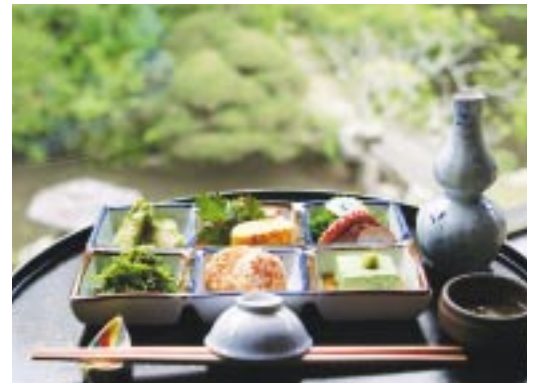
麦とろコースの中の一品

住所／御殿場市川島田284-5 ☎0550-84-3719 営業時間／11:00～14:00、夜は予約のみ(5人～) 定休日／月・火曜 駐車場／20台 メニュー／かわ嶋膳1600円 (1日20食限定)