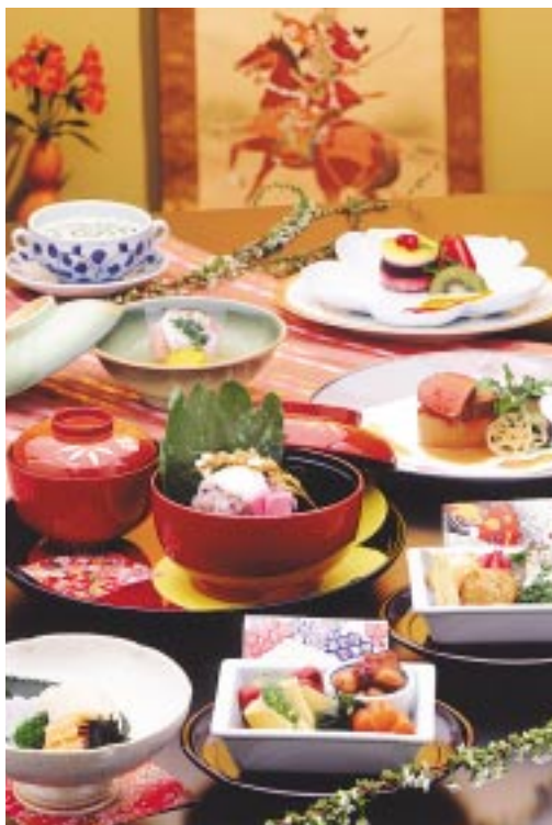
季節ごとにメニューが変わる「千代会席」。旬の食材が目白押しです

はこういう贅沢ランチもいいなとしみじみ感じながら幸せなひとときを過ごしました。食後は庭園の遊歩道を散策。しんとした自然の静寂に包まれて、心が清められました。