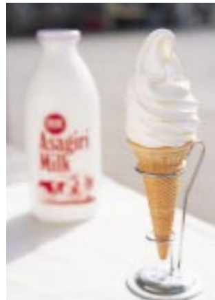
朝霧のソフトクリームは濃厚ながらすっきりとした後味