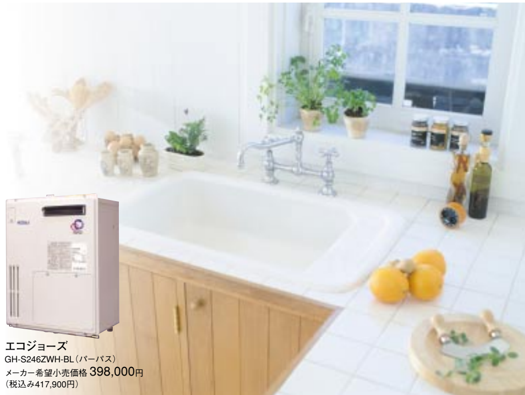
エコジョーズ GH-S246ZWH-BL (パーパス) メーカー希望小売価格 398,000円 (税込み417,900円)

食 器洗いやお風呂など、日常生活に欠かせない給湯器。これまで使っていたものが故障してしまったので、ボーナス時期が近いこともあり、これを機に買い変えることに。