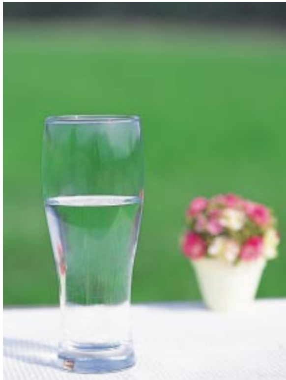
地下15メートルから汲み上げるミネラルたっぷりの富士の湧き水

話題の成分・バナジウムを含む湧き水が汲み放題、さらに熱気球で空中散歩ができるという噂を聞き、家族で朝霧高原へ。この季節にピッタリの清涼感ある旅を満喫してきました。