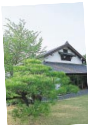
クロマツなどの力強い緑と、ツツジ、百日紅、百合といった季節の花が美しい庭園