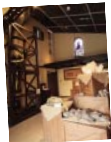
「これも石なの？」たくさんの驚きと発見に出会える場所。