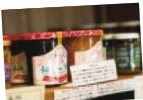
イトインメニューのスイーツや、販売しているジャム類も人気です。