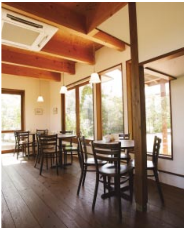
ナチュラル&エコロジー。つい忘れてしまいがちな大切なものにたくさん出会えるカフェ。陽の光さえ空間を和やかに演出しています。

パンつてこんなにご馳走だったのね。そんなことを考えつつお土産用のパンをチョイスするふたり。この素敵な雰囲気までは難しくても、幸せな気持ちのおすそ分けはできるものね。自然な美味しさに触れたことで、家族や身近な人たちへの感謝の気持ちもプラスされたナチュラルな午後のひとときでした。