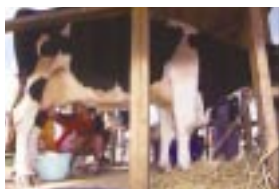
牛の乳搾り体験もできます。

更なるお楽しみは、敷地内の別の建物で行なわれている宝石探身体験。どちらが大きな宝石を見つけれられるか、私も夢中になって息子と競争です。結果は息子の勝ち。ニニコしながら「このピンクの石はお母さんに」と手渡ししてくれたことが一番の思い出になったかもしれせん。 帰りは少しだけ遠回りをして富士ミルクランドへ。搾り立ての牛乳で作られたチーズは、ほんのりとしたミルクの風味が口いっぱいにもびつたりだな、と主人も嬉しそう。自然の神秘と素朴な美味しさに出会えた、とっても素敵な一日でした。