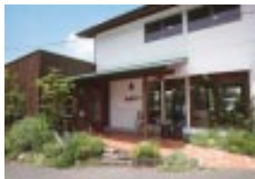
揺れる緑の中、お散歩してみるのも楽しい。