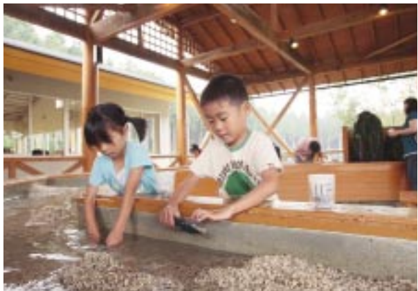
砂の中から宝石を見つけた時の嬉しさは、言葉では表せないほど。

スタッフが初めてであることを告げると、棚にある石をひとつひとつ丁寧に説明してくれました。触ると確かに固いのにくしゃつと曲がる「コンヤク石」。ビブラフォンのように美しい音を奏でる「カンカン石」。自然界の光ファイバーと称される「テレビ石」など、これまでの石に対するイメージが覆されるお話ばかり。また、見るだけでなく気軽に触れることができるのも、大きな魅力のひとつです。