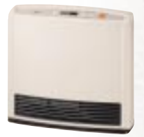
ガスファンヒーター SRC-357E(リンナイ) メーカー希望小売価格(本体) 50,400円(税抜価格48,000円)

寒 い朝が苦手な主人。風邪を引きやすい子供。そして冷えが気になる私。我が家の「冬の困った」を解消してくれたのがガスファンヒーター。操作も簡単でエコジョー。そしてなんと、言っても灯油ファンヒーターだった頃の給油のわずらわしさから解放されたことが本当に嬉しくて。