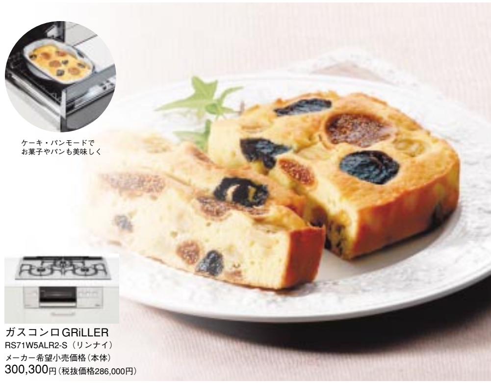
ケーキ・パンモードでお菓子やパンも美味しく

毎日を特別に。特別な日をより特別に。「GRILLER」があれば、毎日が記念日です。