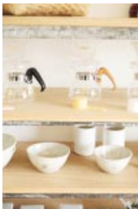
「10年後でも使っていたい」。そんな素敵なコンセプトで集められた雑貨が並びます。