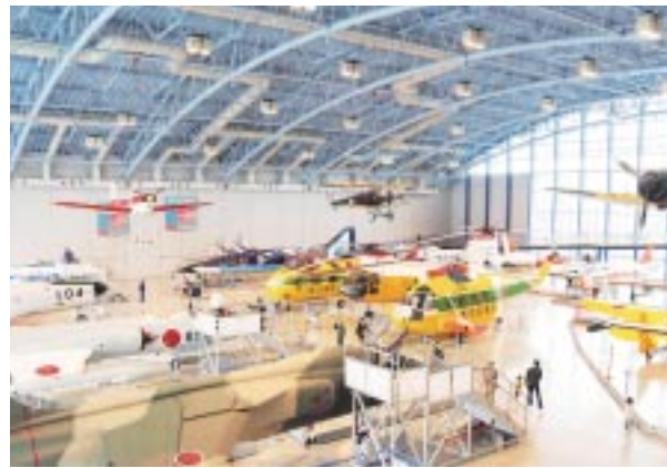
カラフルな色合いの飛行機たちは、実際に航空自衛隊が使用したものだそう。

興奮冷めやらぬ二人を連れ売店へ。「これなあに？」と息子が見つけたのは小さなハーモニカ。吹くとドレミの音がするのよと説明すると、嬉しそうに「こう答えました。」「ドレミの歌なら知ってるよ。大好きなんだ！」。自慢気に話す息子がなんだかとても可愛くて、記念