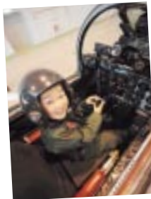
まるで気分は映画の主人公？フライトスーツの試着は子供も大人もOK。