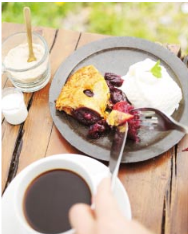
甘さ控えめの手作りチェリーパイは、コーヒーはもちろんハーブティとの相性も抜群。

帰り際、改めて見た看板の文字に思わず笑みが。本当に私たちにぴったりだわ、と思いつつ、本当のゆとりは「慌てない」からこそ生み出せるのだと気付いた有意義な午後ひとときでした。