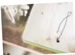
生活雑貨のほか、地元の作家さんオリジナルのアクセサリーなどもたくさん。

awatenvou 住所／駿東郡長泉町下土狩422-12 ☎055-988-6532 営業時間／11:30～14:00(ランチ) 14:00～17:30(喫茶) 17:30～21:00(喫茶&食事) 定休日／月・火曜 駐車場／4台 メニュー／デザート480円～、 ランチ1260円(お茶付、 +315円でデザート付)