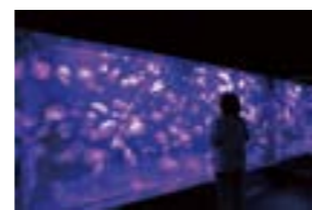
たゆたうクラゲの幻想的な姿に、時の経つのを忘れてしまいそう

したあとお魚をもらうんだ。きつとごほうびだね」「そうね、頑張ったからね」「ううん、みんなを楽しませてくれたからだよ」。そして、舞台裏へと戻っていくイルカたちに、手を振りながら言いました。「イルカさん。ありがとう!」 帰りに寄ったのは沼津みなと新鮮館。香りに誘われ「いかの姿焼きせん」を買い息子に手渡すと、あとでいいからとすぐに主人に。「パパ、先に食べていいよ。僕を楽しませてくれたごほうびにさ」 ちょっと大人染みたしぐさに、くすつとしてしまった私たち。そんなこの子の成長が、小さくても本当の幸せなんだと感じた、爽やかな初夏のひとつときでした。