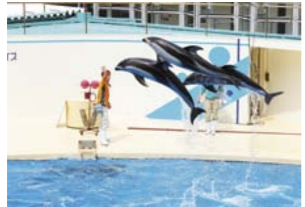
やっぱり一番のお楽しみは海獣ショー。見事なイルカのジャンプに、思わず歓声が

ビ ックリ顔の息子が、突然こんなことを言いました。「カイジウって本当にいるの?」。何かと思ってみると、テレビからイルカショーの映像が。はーん、さでは「海獣」と怪物がごちゃ混ぜになっているのね。そんなこともあり、伊豆三津シーパラダイスへ出かけることに。最近、新しい水槽ができたと聞き、私たちも興味津々です。 まずはセイウチのお出迎え。「うわあ、大きい」と目を丸くして眺めています。緑色が美しいサンゴの水槽やクラゲのコーナーでは、幻想的で美しい光景に言葉が失うほど。どれだけ観ていても飽きることはありません。 さてお楽しみ「海獣ショー」です。アシカの見事な書道パフォーマンス「見怖そうだけどユーモラスなトド」; 思わず童心に還るようなトリを飾るカマイルカの「スゴ技」は、手を叩いて歓声を上げてしまうほどです。 ショーも終盤に差し掛かった頃、息子がこう言いました。「ジャンプ