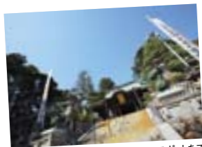
御真殿など境内の三十三番パワースポットをスタンプラリーで巡ることができるそう