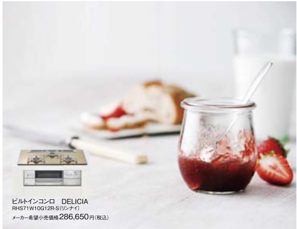
ビルトインコンロ DELICIA RHS71W10G12R-S(リンナイ) メーカー希望小売価格286,650円(税込)

子供が生まれてからはもちろん、大きくなった今でも食べるものは「おいしくて安全」が一番。そんな我が家は、できる限り、手作り宣言発令中。「ガスでごはんを炊くと美味しい」と主人からの提案で、自動炊飯機能がついたガスコンロにしたところ、なんとその機能でジャムが作れる！と知り、今日は小粒のいちごをたっぷり使って、甘さ控えめのヘルシージャムに挑戦です。 材料はいちごと砂糖、それにレモンの絞り汁のみ。炊飯鍋に入れ、ふたとの間に布巾をはさんでスイッチオン！あとは完成を待つだけなんです。何時間も混ぜ続ける必要もないから、子供と一緒に話しながら作れるのもとっても魅力的ね。 実は甘党の主人。出来上がったいちごジャムを味見するなり「うまい！これ作るの大変だっただろう？」と大絶賛。もちろんよ、と言いながら子供とふたりでにんまり。今度ほどのフルーツにする？ お野菜でもできるかな。ヨーグルト買ってこようよ！と、つついっ止まらなくなるおしゃべりこそ、大事な幸せレシピです。