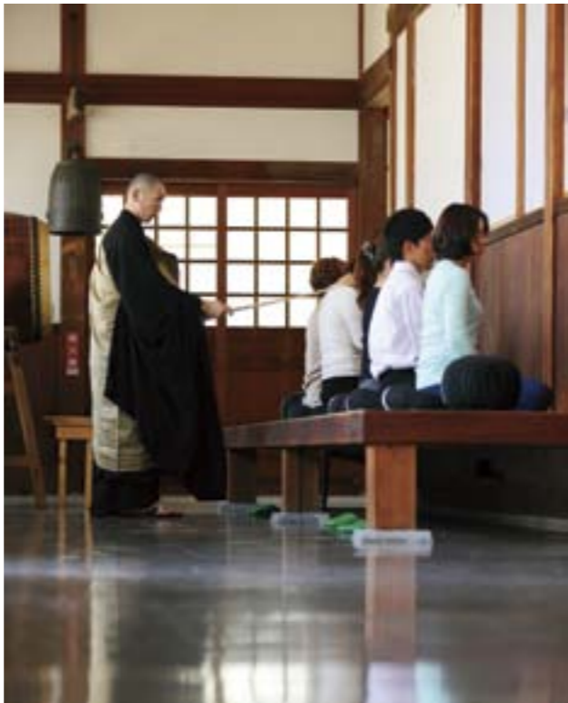
鳥のさえずり、風の音。すべてをあるがままに受け止め、ただひたすら座ることに意味があるそう

さてお待ちかねの精進料理です。思った以上のボリュームと鮮やかさにふたりともびつくり。手間を惜しまずひとつひとつ造られた料理たち。その味わいは、写経と坐禅でお洗濯された心にも優しい味わいでした。 「ここに祀られている炎の神様って、いろんな炎から守ってくれるんだって」と、ごま豆腐を食べながら彼女がぼつり。そして、「願いがかなう真言もあるのよ、えっと…なんだったかな」と言いながら、うふふと笑う彼女。肝心なところを忘れちゃうなんて彼女らしいと言えばらしいけど…いろんな炎ってなんだろっ？ お腹も満たされたところで境内を散策。本堂脇の階段を上がると、秋葉総本殿三尺坊様のご真殿がありました。「あ、これこれ」と彼女が見つけたのは、さっき言っていた願いを叶えるご真言が書かれた紙。オン。ピラピラ。ケンピラケンノウ。ソワカ。3回唱えてから願いをかけるそう。同時に目に入ったのは「三毒の煩惱」。むさぼりの炎、怒りの炎、愚痴の炎。確かにどれも心には毒ね、と思った瞬間気づきました。私から彼女へのメール、愚痴ばかりだったかも。 彼女が書いた写経の為書きは、「世界平和」。それなら私は彼女のために願おう。オン。ピラピラケンピラケンノウ。ソワカ、ずっとそのままのあなたでいて、と。