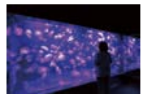
たゆたうクラゲの幻想的な姿に、時の経つのを忘れてしまいそう

したあとお魚をもらうんだ。きつとごほうびだね」「そうね、頑張ったからね」「ううん、みんなを楽しませてくれたからだよ」。そして、舞台裏へと戻っていくイルカたちに、手を振りながら言いました。「イルカさん。ありがとう!」 帰りに寄ったのは沼津みなと新鮮館。香りに誘われ「いかの姿焼きせん」を買い息子に手渡すと、あとでいいからとすぐに主人に。「パパ、先に食べていいよ。僕を楽しませてくれたごほうびにさ」 ちょっと大人染みたしぐさに、くすつとしてしまった私たち。そんなこの子の成長が、小さくても本当の幸せなんだと感じた、爽やかな初夏のひとつでした。