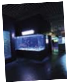
海の中を体感! 驚きと発見の連続です